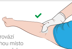
obrázek č. 1

Dětskému pacientovi pomůže místo vpichu stlačit osoba, která jej doprovází (rodič, zákonný zástupce). Starším a imobilním pacientům, kteří nemohou místo vpichu dostatečně stlačit, může personál odběrového místa na nezbytnou dobu zatáhnout ruku v místě vpichu speciálním obinadlem (esmarsh).